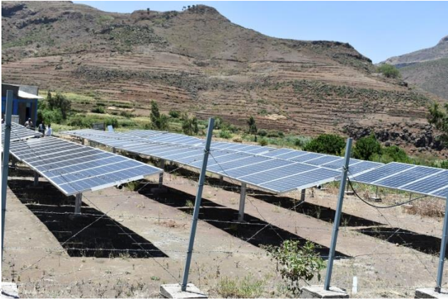
ከምዝሃነፀት ካብ መረዳእታታት ምፍላጥ ተኸኢሉ።

ትካላት ድማ የቆንዶልና” ክትብል ሐሳባ ገሊ። ዑደተኛታት ድማ ድሕረ ህንፃት እውን ምስራሕን ምክትታልን ከምዘድሊ ርኢቶና ገሊፅና ኢና። ኣብዛ ከተማ ዝረአናዮ ካልእ ስራሕ ህንፃት ዓብዩ መኽዘን እኽለ እዩ። ልዕሊ 10,000 ኩንታል እኽለ ይሕዝ። ዕላማ እዙ ህንፃ ህዝቢ ምግብ ንስራሕ ኮነ ህፁፅ ሓገዝ ኣብ ቀረብኡ ንምርካብ እዩ። ድኽነት እናጠፍአ እንትኸድ ድማ ሓረስቶት እቲ ከባቢ ፍርዶቶም መቐመጢ ክጥቀምሉ እዮም። ማረት ከምዚኣም ዝበሉ ደረጃኦም ዝሓለዉ ህንፃታት ብምህናፅ ኣብ መላእ ትግራይ ልዕሊ 60 መኽዘናት